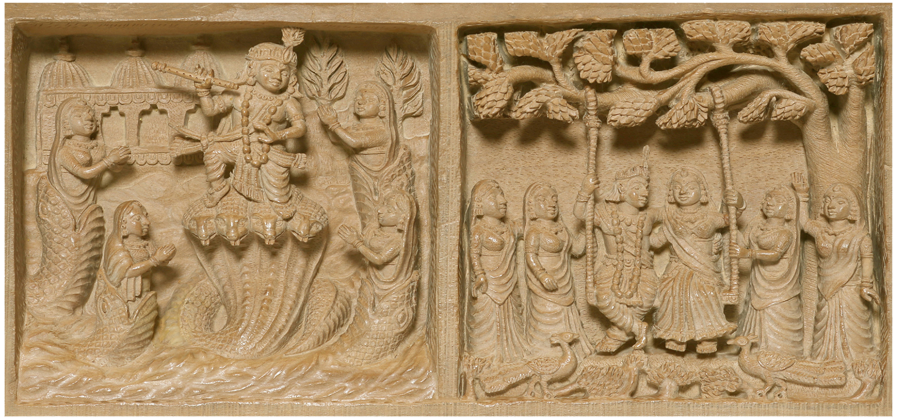
蛇王カーリヤ退治？