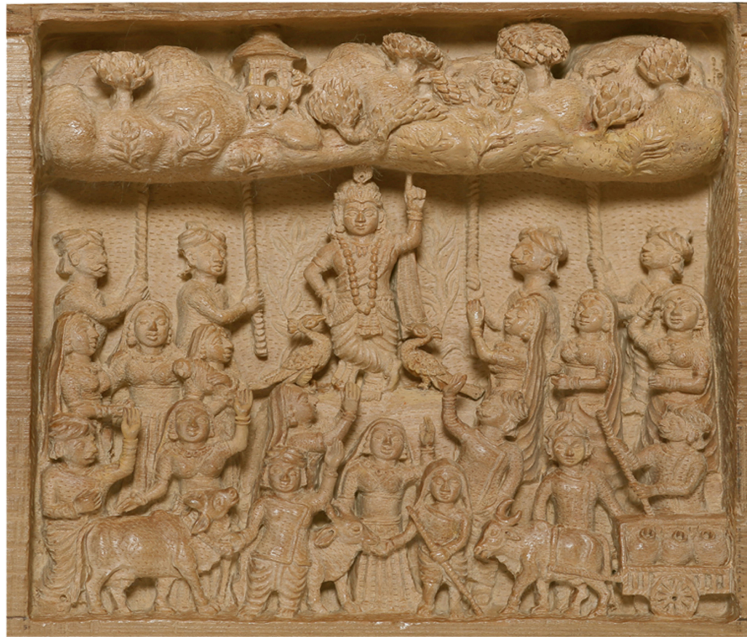
山をこの指一本に載っけて 大雨から牛飼い達を守る